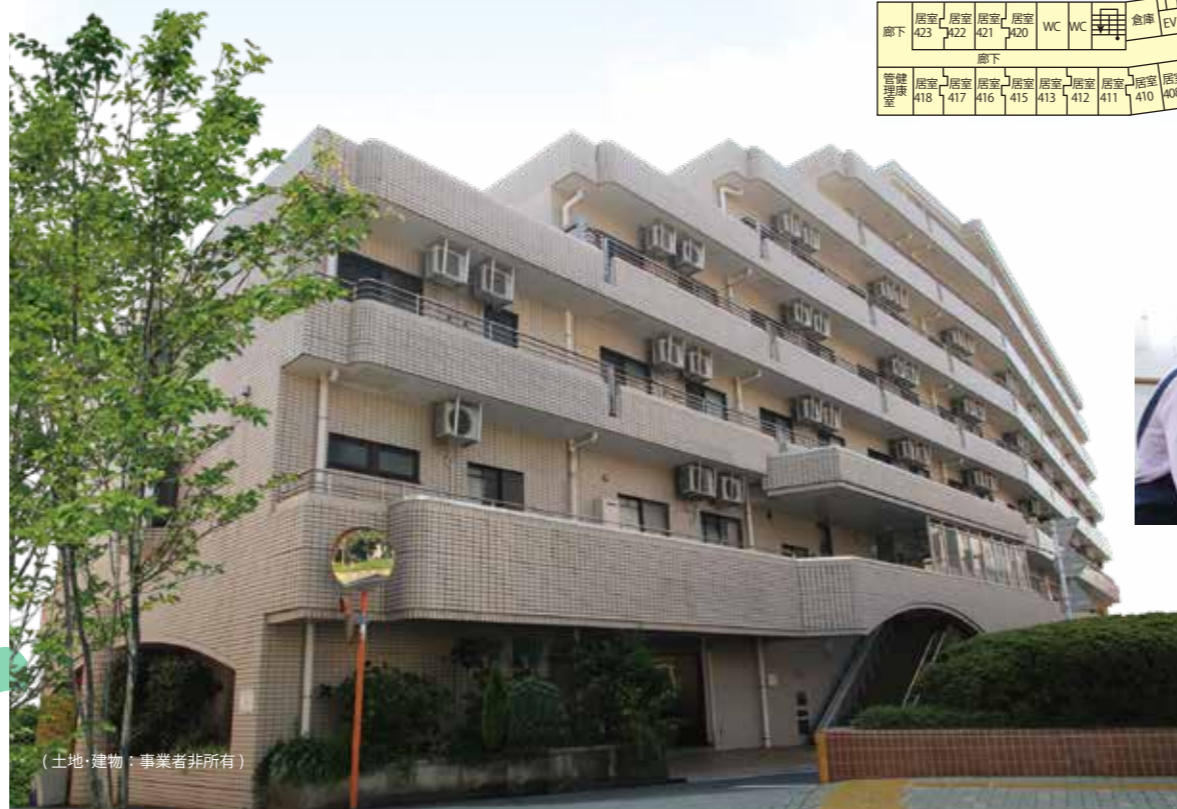
(土地・建物：事業者非所有)