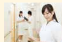
◎イベントも充実の通いサービス 写真はグループ他施設でのご様子