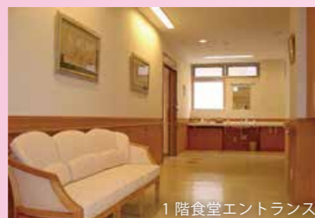
1階食堂エントランス