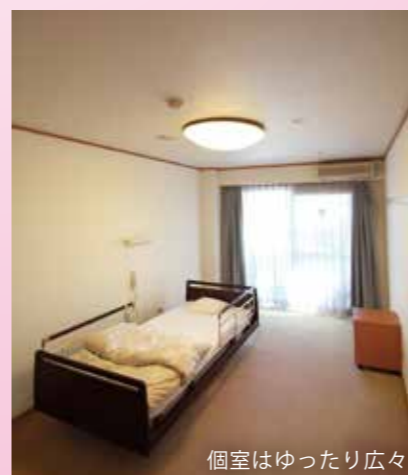
個室はゆったり広々