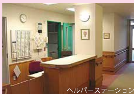
ヘルプステーション