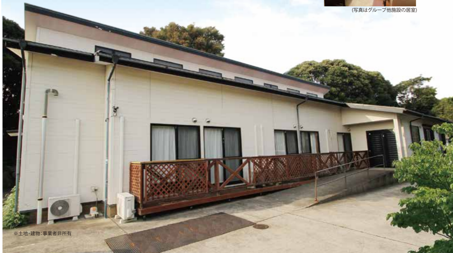
※土地・建物：事業者非所有