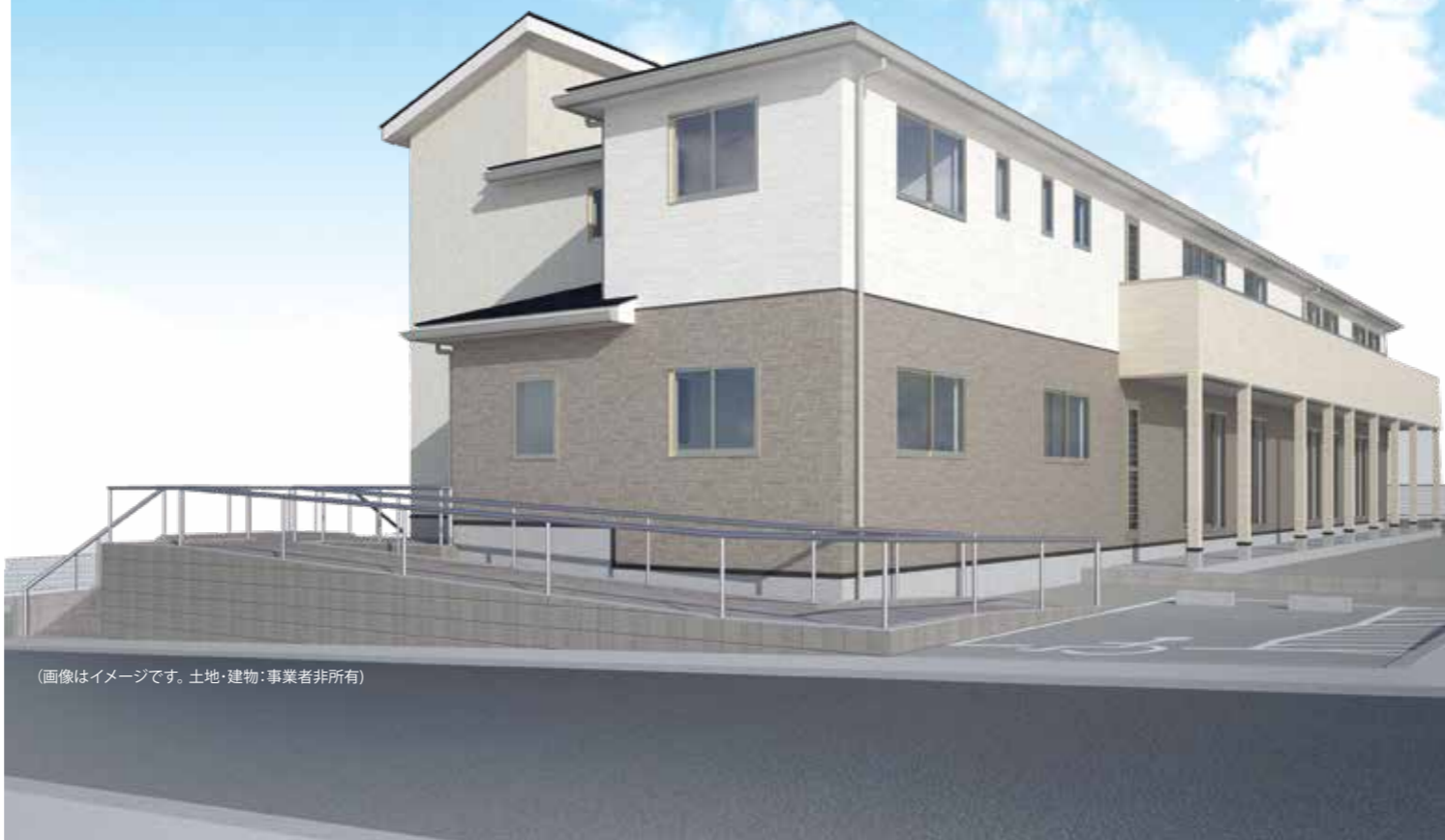
(画像はイメージです。土地・建物：事業者非所有)