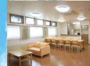
※写真はグループ他施設の設備