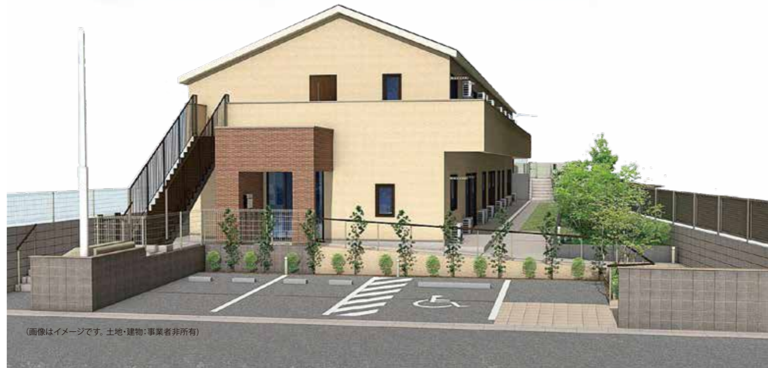
(画像はイメージです。土地・建物：事業者非所有)