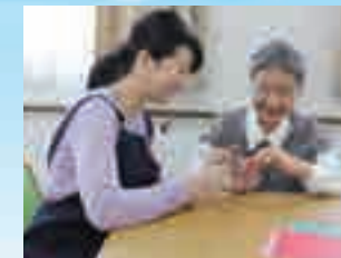
※写真はイメージ写真です