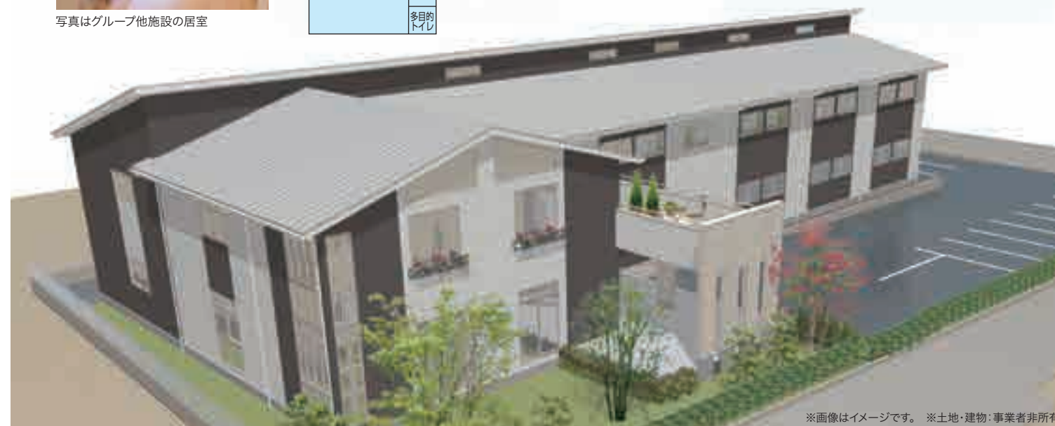
※画像はイメージです。 ※土地・建物・事業者非所有