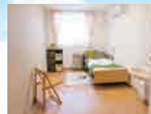
写真はグループ他施設の居室