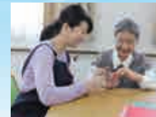
※写真はイメージ写真です