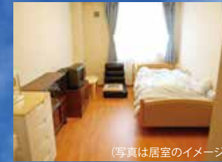
(写真は居室のイメージ)