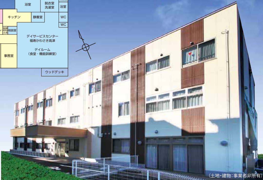
(土地・建物・事業者非所有)