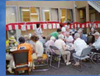
(写真はグループ他施設での生活の様子)