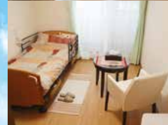
※写真はグループ他施設の設備