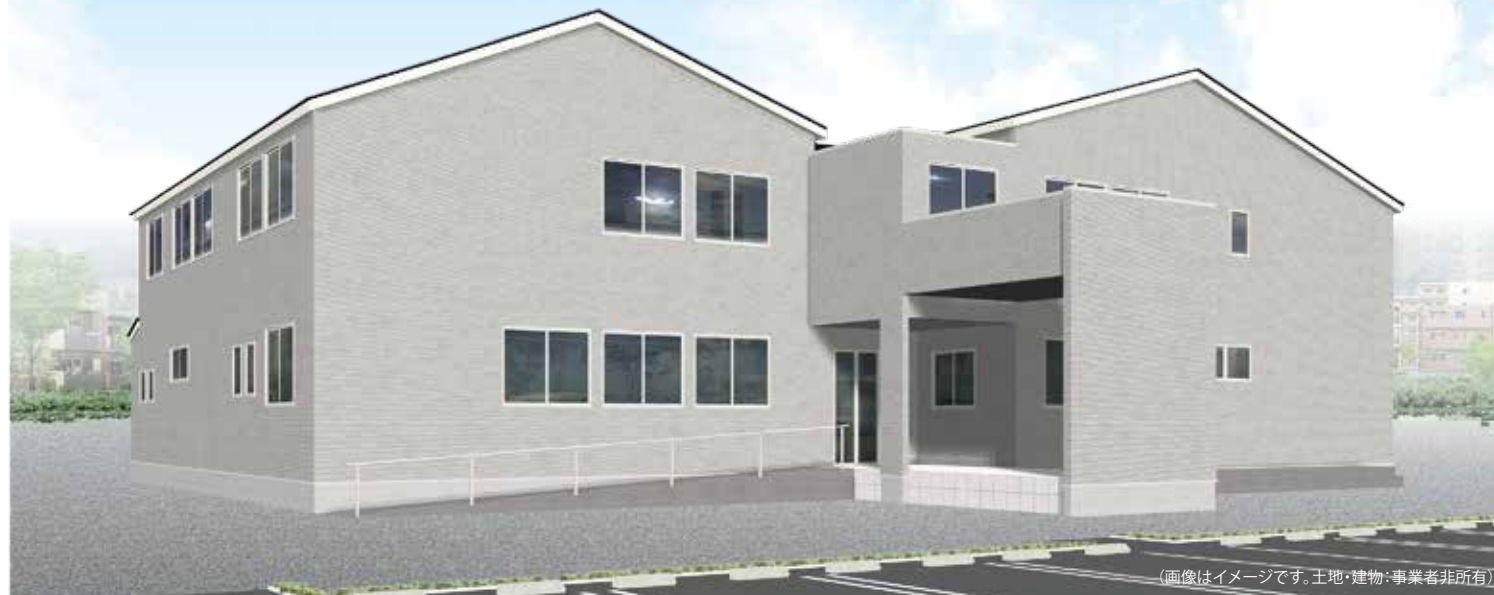
(画像はイメージです。土地・建物:事業者非所有)

■類型/住宅型有料老人ホーム■居住の権利形態/利用権方式■利用料の支払方式/月払い方式■入居時の要件/要介護・要支援■介護保険/介護保険サービス利用可■居室区分/全室個室■土地建物の権利形態/普通建物賃貸借契約30年■共用施設・設備/食堂兼機能訓練室、浴室、トイレ、洗面設備、相談室、健康管理室、緊急コール他■敷地面積/950.79㎡■延床面積/924.46㎡■構造/木造2階建■定員/30名■居室総数/30室■居室面積/13.04~13.24㎡■開設年月/2022年8月