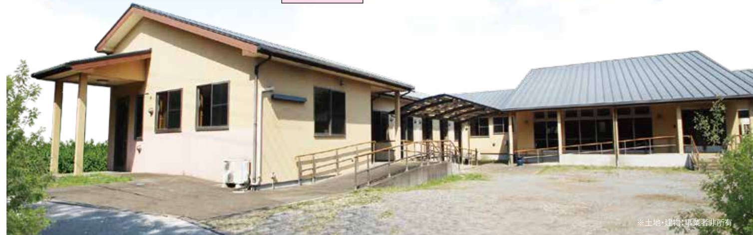
※土地・建物・車庫等非所有