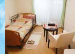
※写真はグループ他施設の設備