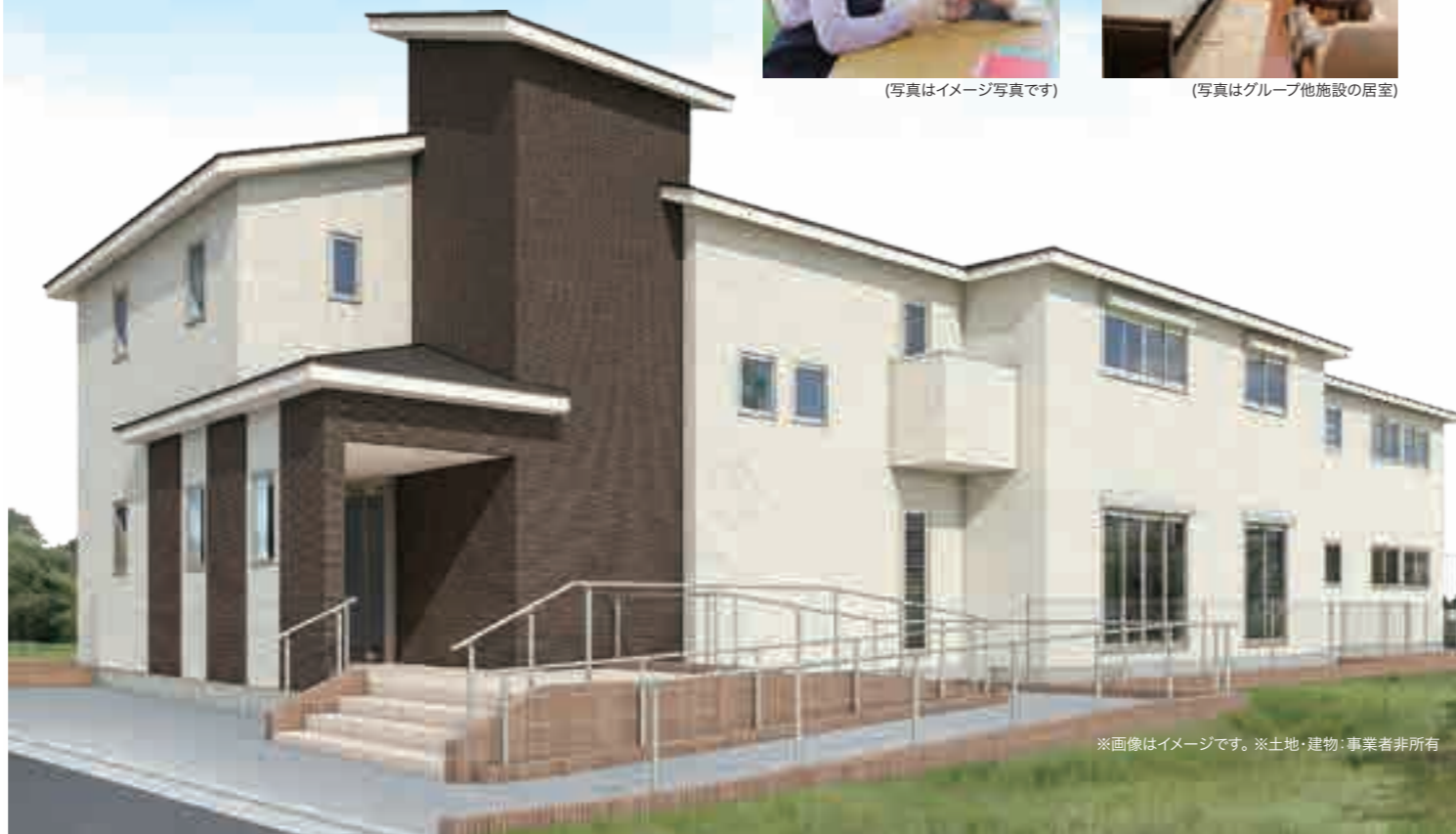
※画像はイメージです。※土地・建物・事業者非所有