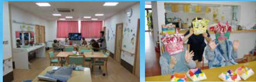
(写真はグループ他施設での生活の様子)