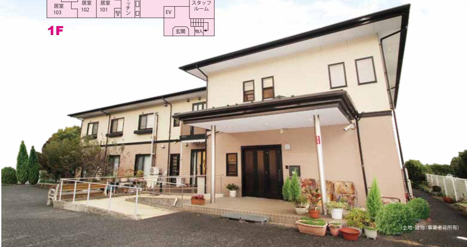
(土地・建物:事業者非所有)