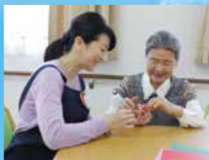
(写真はイメージ写真です)