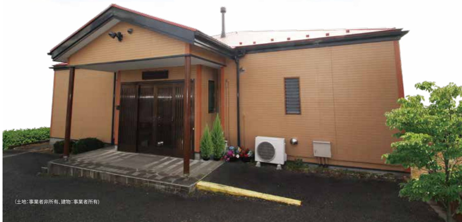
(土地:事業者非所有、建物:事業者所有)