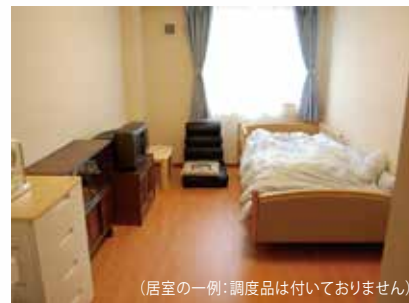
(居室の一例：調度品は付いておりません)