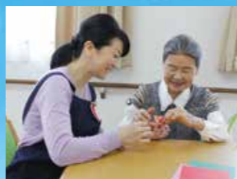
(写真はイメージ写真です)