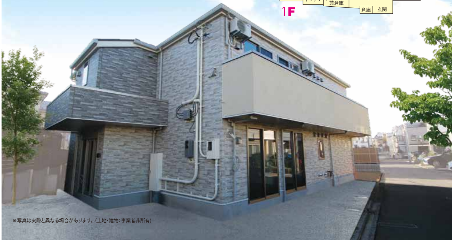
※写真は実際と異なる場合があります。(土地・建物:事業者非所有)