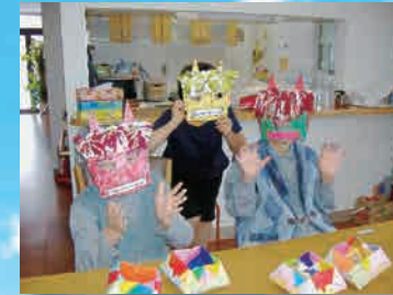
(写真はグループ他施設での生活の様子)