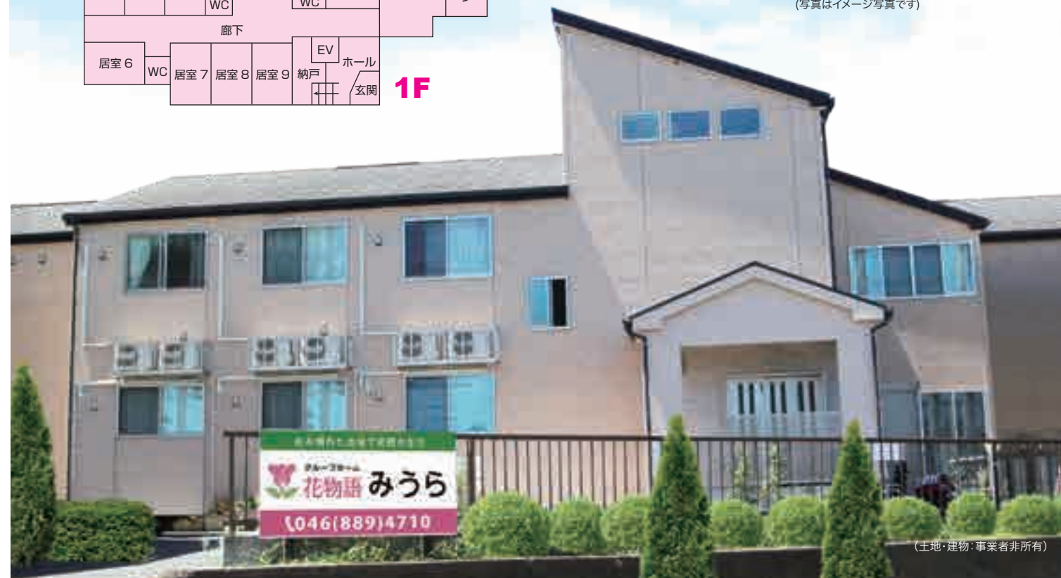
(土地・建物・事業者非所有)