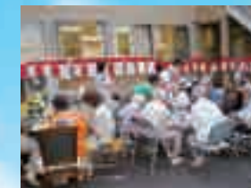
(写真はグループ他施設の生活の様子)