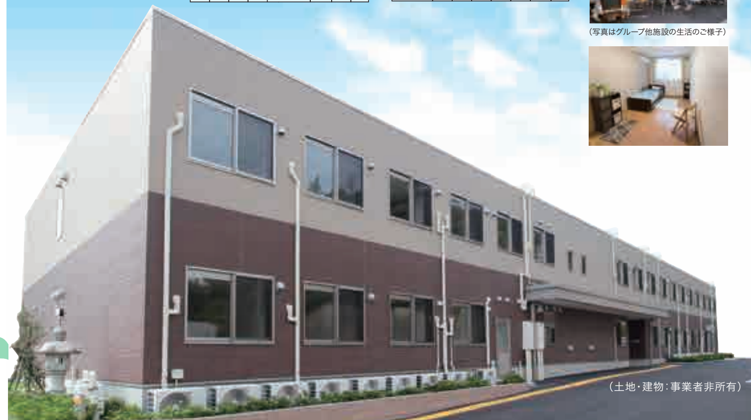
(土地・建物：事業者非所有)