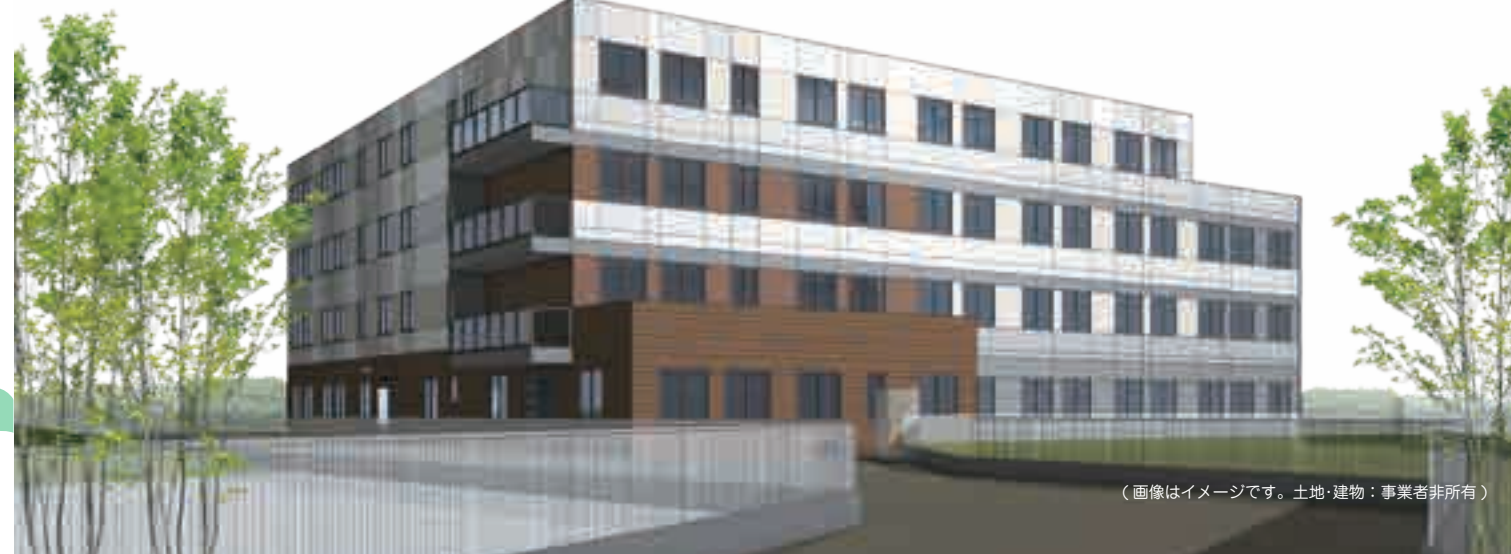
(画像はイメージです。土地・建物：事業者非所有)