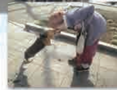
(写真はグループ他施設での生活の様子)