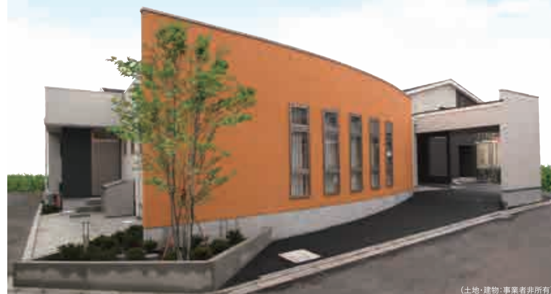
(土地・建物・事業者非所有)