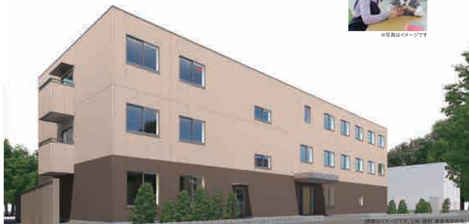
(画像はイメージです。土地・建物:事業者非所有)